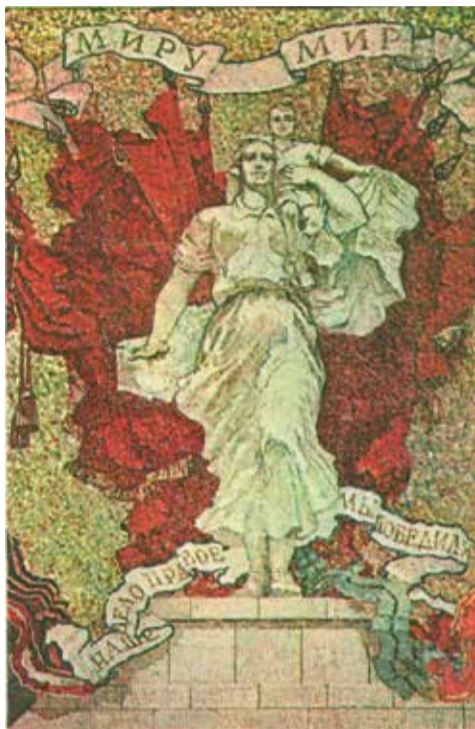
Мозаика на станции метро «Автово»